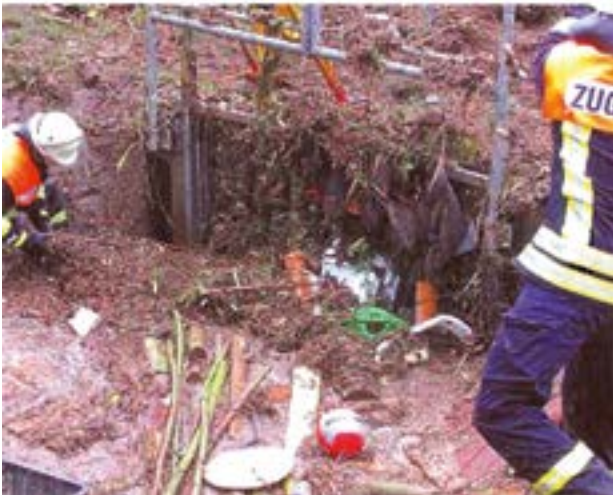
Aus den BWK Fachinformation 01/2013