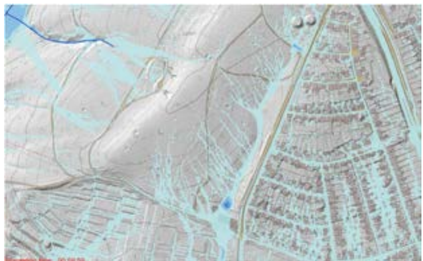
Ergebnisdarstellung einer Oberflächenabflusssimulation für ein Extremereignis in Saarbrücken, eepi 2015

Die Erstellung der Konzepte wird mit bis zu 90 Prozent durch die Länder gefördert.