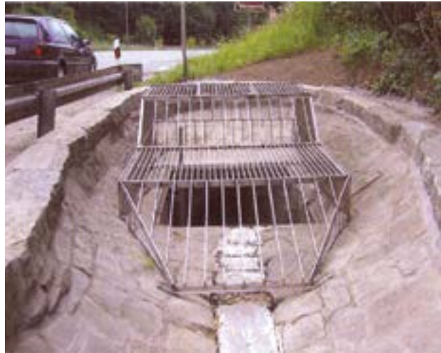
Aus den BWK Fachinformation 01/2013

Die Darstellung der überflutunggefährdeten Flächen und Objekte alleine reicht zur Bewertung des Risikos nicht aus, welches erst durch die Einbeziehung des möglicherweise verursachten materiellen Schadens abgeschätzt werden kann.